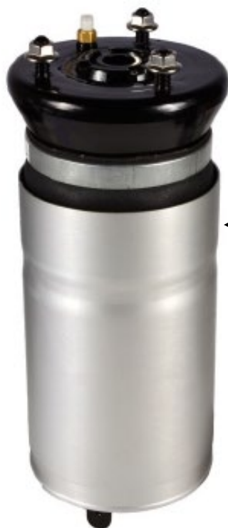
5. 1x Módulo de balona de suspensión neumática